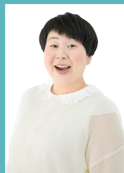
ふたりの未来応援アンバサダー 大島 美幸